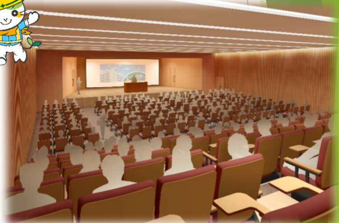
A棟(新病棟)オーディトリウム（387㎡, H31.3完成予定）