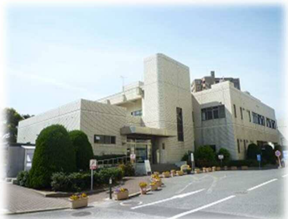
医学部図書館（RC造2階建 2,043㎡）