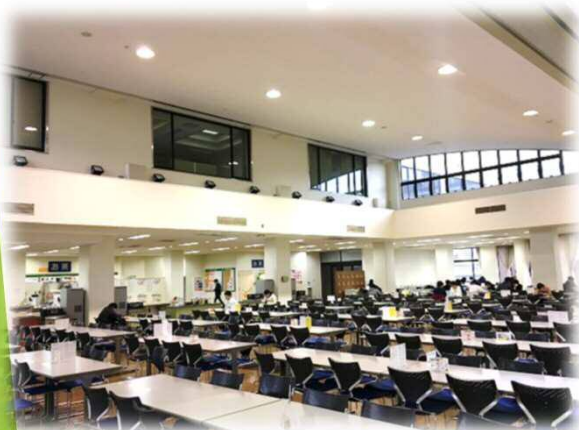
工学部福利厚生棟食堂（767㎡）