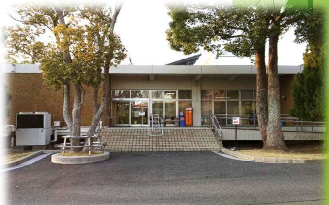
工学部図書館（RC造2階建 2,353㎡）