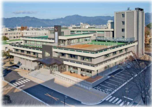
総合図書館（RC造3階建 4,520㎡）