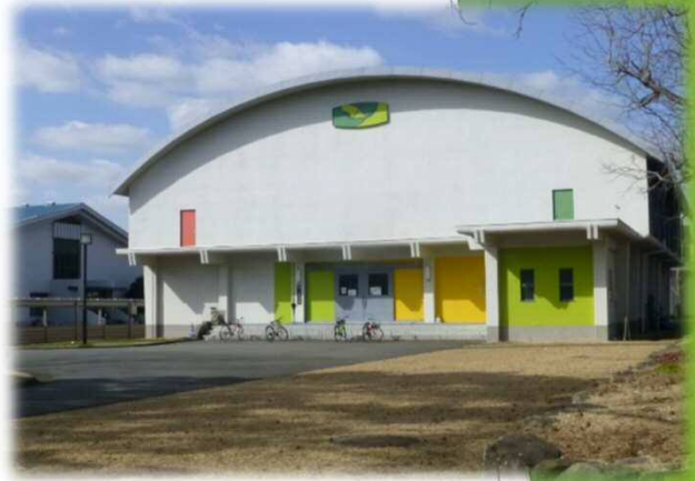
第2 武道場（S造平屋建 607㎡）